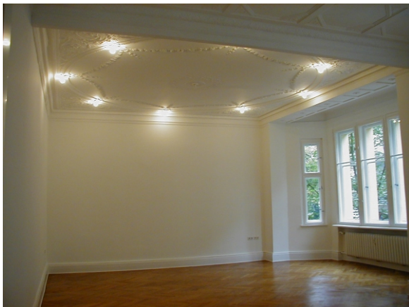
Decken monochrom weiß gefasst