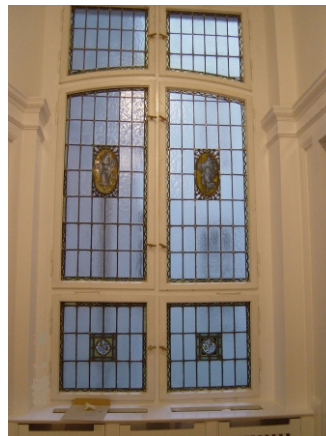
Fenster zum Lichthof