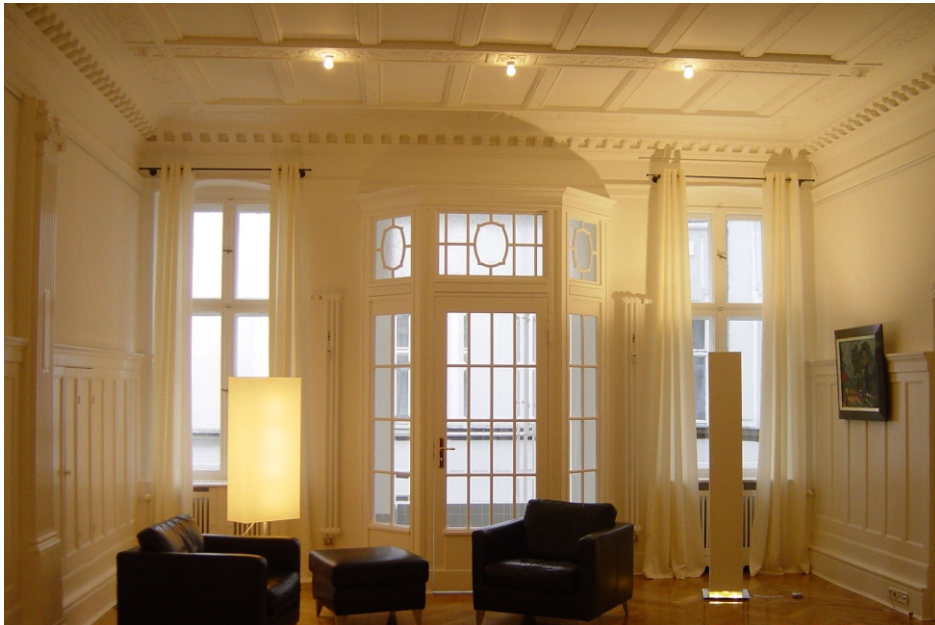
Blick in den Wohnbereich mit Eichenparkett