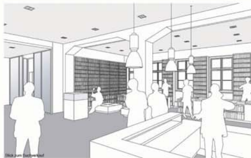
Blick zum Buchladen

Für die Mahn- und Gedenkstätte Sachsenhausen/ Oranienburg, wurde 1996 durch Braun & Voigt eine Zielplanung für das Gesamtareal auf der Grundlage eines dezentralen Ausstellungs-konzeptes erarbeitet.