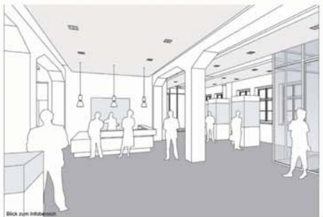
Blick zum Informationszentrum